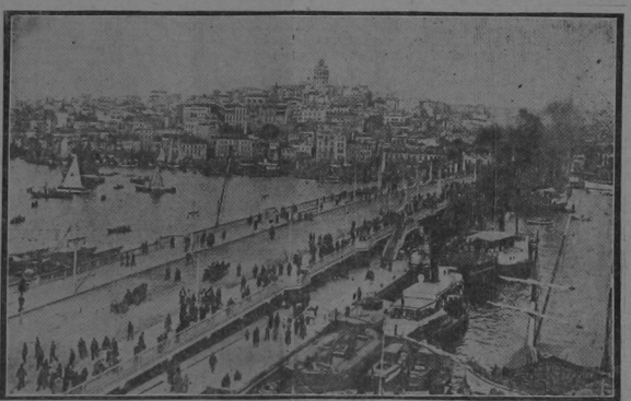
Nuestro grabado representa una fotografía de la ciudad de Constantinopla, capital de Turquía, punto de mira de un enorme ejército de hombres de diferentes nacionalidades, que están sacrificando sus vidas para alcanzar el premio codiciado. Junto al puente los submarinos ingleses, con una actividad asombrosa, han destruido todos los transportes turcos, haciendo así más grave la situación militar de la ciudad.

zaron con empuje y tenacidad increíbles, y conquistaron a la bayoneta importantes posiciones. En el sector de Montenero capturamos una enorme trinchera situada debajo de la cima de Mezi y en el sector de Tolmi o numerosas y bien provistas trincheras. En la colina de Santa Lucia, al Norte de Goritz, nos apoderamos de una sólida reduta. En el valle y en las pendientes del Monte Sibotino y en Carso, rompimos en muchos puntos las poderosas líneas del enemigo y las fuerzas adversarias fueron aniquiladas y dispersadas. Hicimos 1184 prisioneros de los cuales 25 son oficiales.