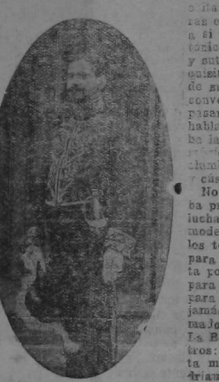
Don Bartolomé Carbajal y Rosas

Una triste noticia tenemos que anunciar a nuestros lectores: el fallecimiento ocurrido en los Estados Unidos del ilustre diplomático y distinguido caballero don Bartolomé Carbajal y Rosas, quien por varios años fué Enviado Extraordinario y Ministro Plenipotenciario de México en España.