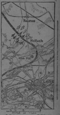
Este mapa muestra la posición sobre la cual los alemanes y los ingleses han librado combates enzarzados al Norte de Lens. La altura 70 que se muestra en el punto es el mapa de acción de los grandes aliados británicos, donde han podido darse entrada en las líneas alemanas acercándose así a Lens.

Al mismo tiempo que los británicos (trataban de echar a los alemanes por medio de ataques formidables, éstos trataban a su vez de cortar las líneas en el flanco que rodea a Hulloch, como puede verse en el mapa por las cejas blancas. Hulloch es una posición estratégica poderosamente defendida, rodeada en distancias convenientes por minas y por trincheras que hacen casi impugnable aquel lugar. De allí que los combates librados al Norte de Lens hayan sido tan encarnizados y violentos.