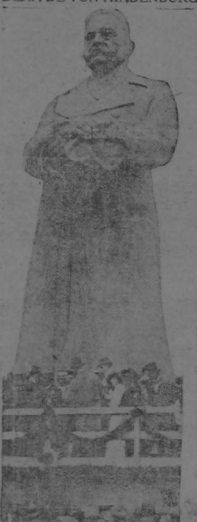
WOODROW WILSON EN LA MAJESTAD DEL MONUMENTO DE MADERA DE VON HINDENBURG

LA GRAN ESTATUA DE MADERA DE VON HINDENBURG